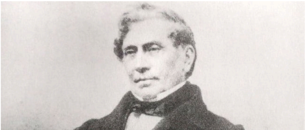
Dr James Barry